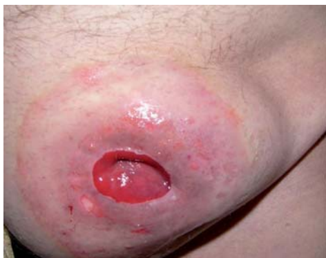
Parastomální kýla + retrakce stomie

Píštěle okolo stomie – některá chronická onemocnění tvoří píštěle a ty se mohou nacházet i v okolí stomie. Způsobují nepřílnavost pomůcky, podtékání a iritaci okolí. Nutno navštívit lékaře.