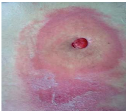
Iritace peristomální pokožky při podtékání pomůcky