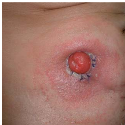
Alergická reakce na pomůcku