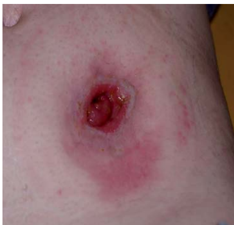
Retrakce stomie + iritace peristomální pokožky