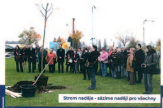
Strom naděje - sázíme naději pro všechny