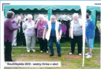
Kouličkyda 2013 - sestry Onka v akci