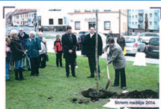
Strom naděje 2014