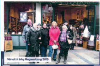
Vánoční trhy Regensburg 2019